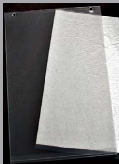
Plakattasche mit Ösen / Haftvlies