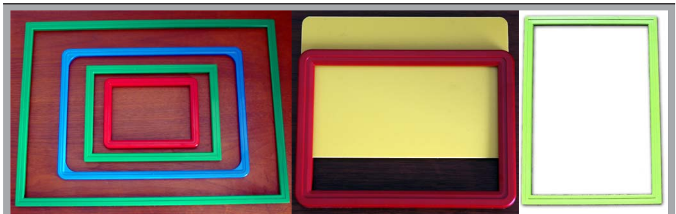
S / L